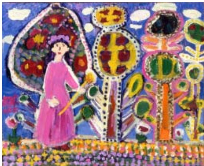
お花畑 A Flower Garden 606x727(mm) © Mizuki Tanaka 1988