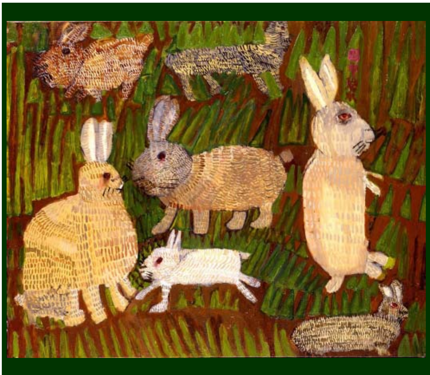
七羽のうさぎ Seven Rabbits 727x910(mm)©Mizuki Tanaka 1996

海から海へは、障がいをもつ人から渡される豊富なものの存在に気づき、人々と共有するため、障がいをもつ人を中心とした、文化芸術活動、研究活動、社会教育活動、心理カウンセリングなどの支援活動を行うこと、および、それらの活動を通し、障がいの有無にかかわらず、地域・国内・国外を問わず広く交流を深め、人々がより良く生きること貢献することを目的とします。