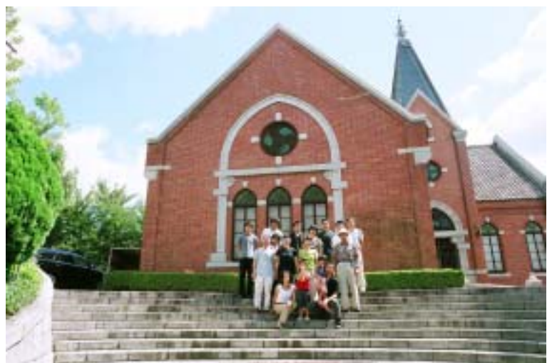
最終日、搬出を終えたボランティアの学生さんたちや仲間と一緒に 会場の王子市民ギャラリー前にて