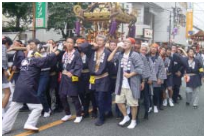
2007年9月布多天神社秋季例大祭にて上布田商栄会の皆さん

暮れには、同会の忘年会に出席しました。ごあいさつから、上布田商栄会は調布で第二の規模とのこと、活発な活動がうかがえました。多くの方とお知り合いになる良い機会となりました。「Mちゃんは毎朝7時40分頃うちの前を自転車を通るよ」、「いつも気にしてる、みんなそうだよ」と、障がいをもつ画家のことを愛情こめてお話しされます。近くの広い場所に美術館を建設しようとお話しされる方もいらっしやいます。嬉しいことです。今後、住みやすいまちづくりへ向け、協力して活動していきたいと思ひます。