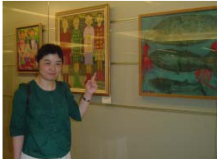
「アート展 めくもりのある日本、みんなが隠れた才能を持っている」にて