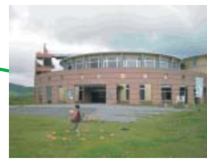
南牧村図書館は 村一番のロケーション