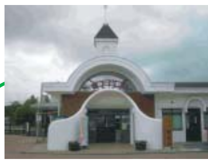
野辺山駅 (JR 小海線) 展示会はすぐそこです