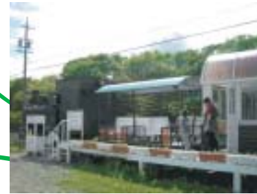
子どもたちの夢 SL ランド