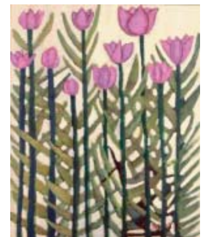
チューリップがいいね 2009