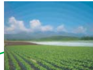
ここは日本一の高原野菜の産地 畑ではレタス、トマト、キャベツなど