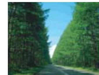
音楽堂に向かう道 落葉松の並木