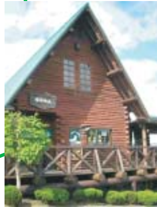
最高地点のおそば屋さん いつもお客さんでいっぱいです