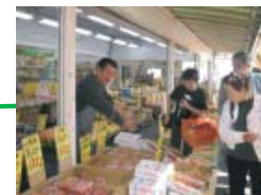
いらっしやいらっしやい いつも大賑わいの野菜市場