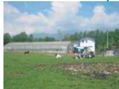
なんと! 南牧村ではジャージー牛の 数が人口より多い