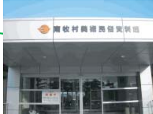
展示会場入口 みなさまのおいでをお待ちしています