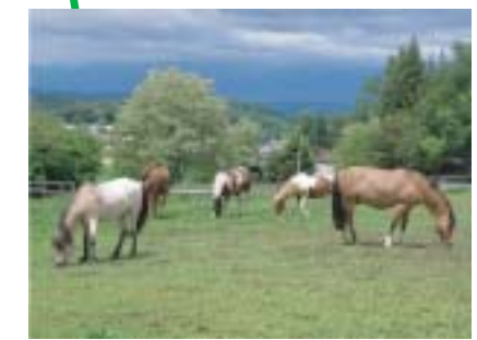
ちょっと足を伸ばせばこんなすてきな場所が 車で40分のまきばカフェ (乗馬と宿泊) 俊彦さんとゆらぎさんが笑顔でお迎え