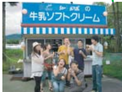
我を忘れるおいしさ 牛乳ソフトクリーム天下一品 ヨーグルト入りもあるよ!