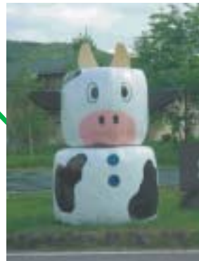
牛の干し草 おいしいお乳の素