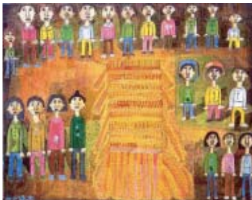
八ヶ岳のキャンプファイヤー 2007