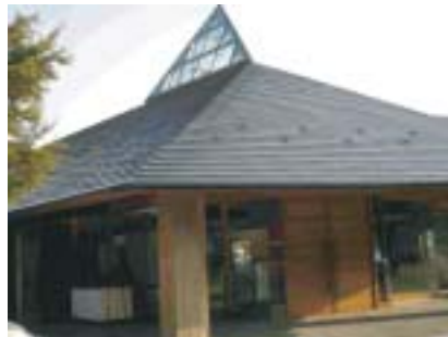
武満徹も愛したという 八ヶ岳ロッジの音楽堂