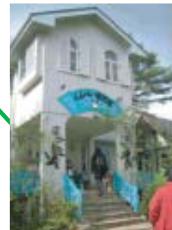
小淵沢のくんぺい童話館 優しい気持ちになれるところ