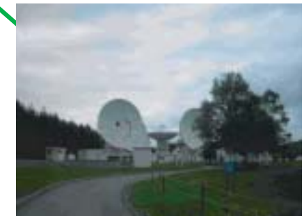
国立電波天文台 宇宙とツナガッテイル