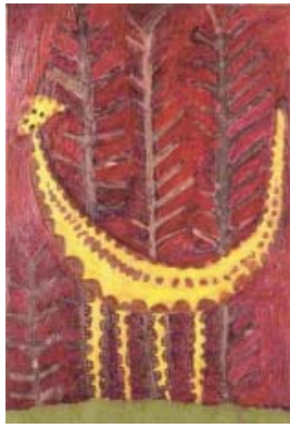
秋のサファリパーク 1994