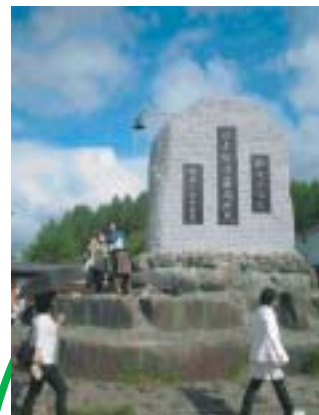
JR 最高地点 記念写真のメッカ