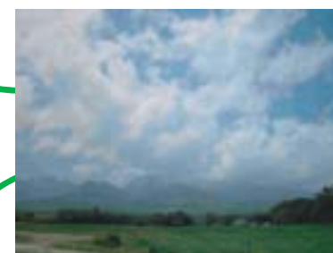
八つの山が集まって八ヶ岳です