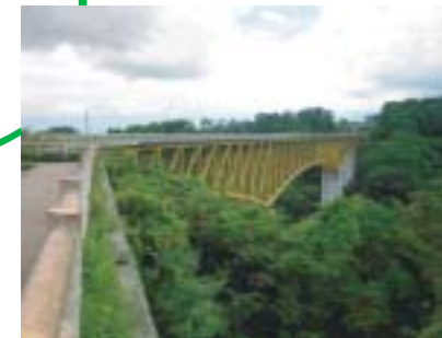
絶景かな! 八ヶ岳高原大橋