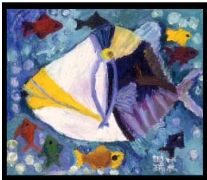
さかな 455x530 © Mizuki Tanaka 1987