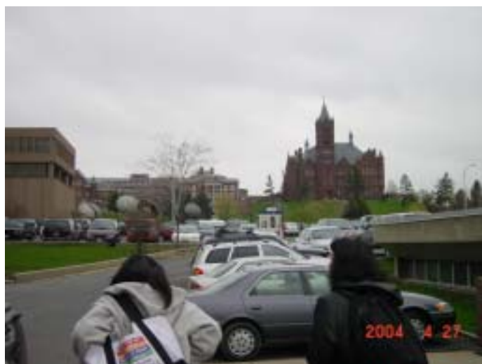
シラキュース大学