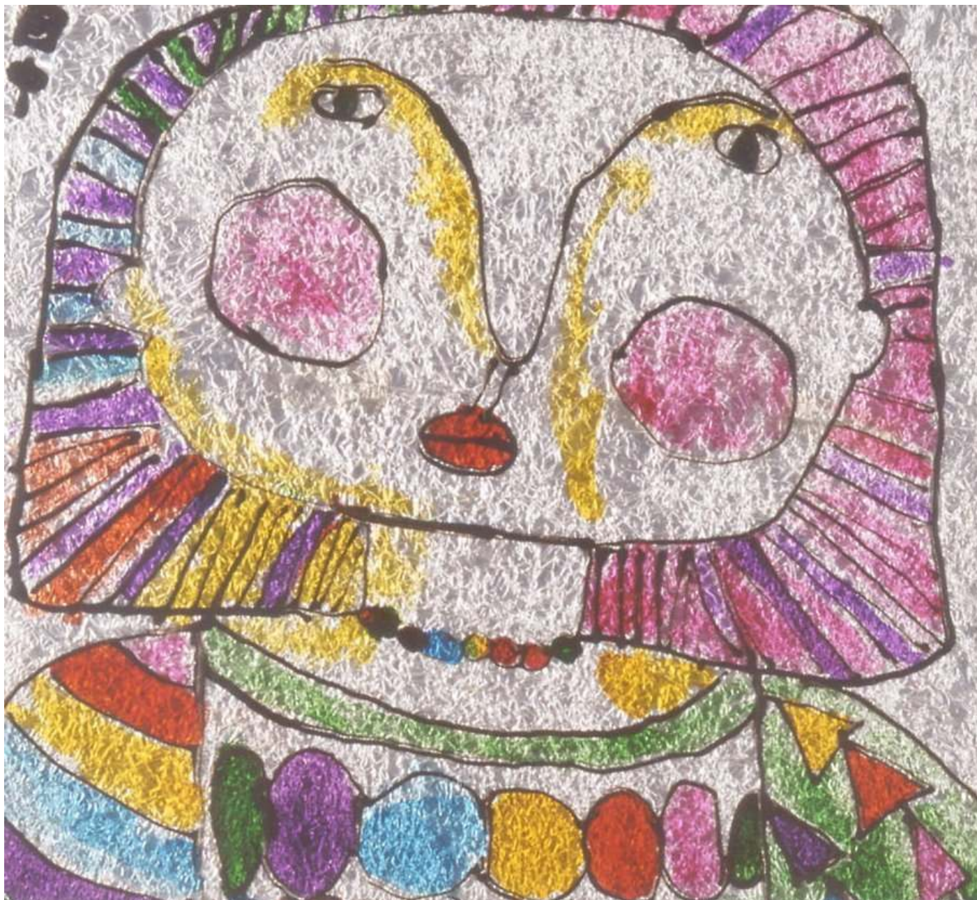
おひめさま 300x350 1987 © Mizuki Tanaka

海から海へは、障がいをもつ人から渡される豊富なものの存在に気づき、人々と共有するため、障がいをもつ人を中心とした、文化芸術活動、研究活動、社会教育活動、心理カウンセリングなどの支援活動を行うこと、および、それらの活動を通し、障がいの有無にかかわらず、地域・国内・国外を問わず広く交流を深め、人々がより良く生きることに貢献することを目的として活動しています。