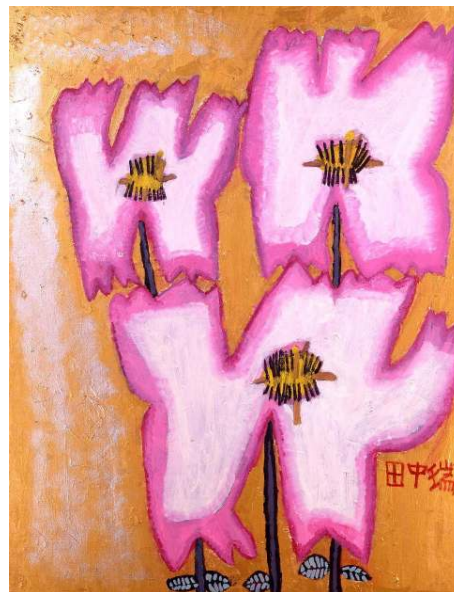
さくら 1167x910 1996 © Mizuki Tanaka