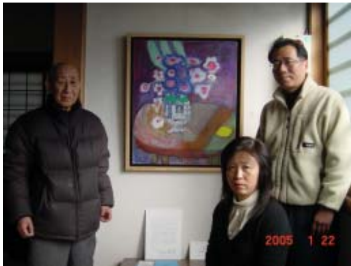
① 西照寺 (酒井先住職と住職ご夫妻)