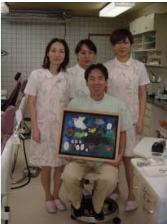
③ 澤歯科医院 (院長とスタッフ)