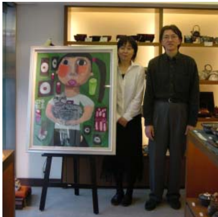
⑤ うつわ和季（店主ご夫妻）