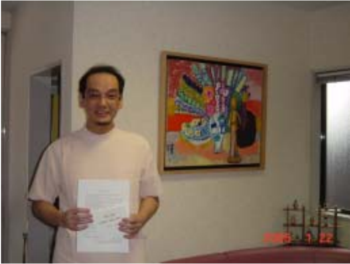
⑥ 船田歯科医院（船田院長）