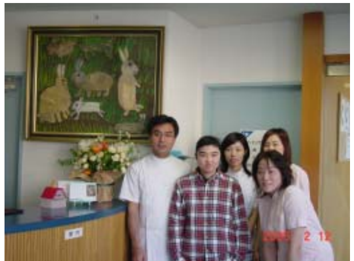
② つつじヶ丘動物病院 (院長・スタッフと瑞木さん)